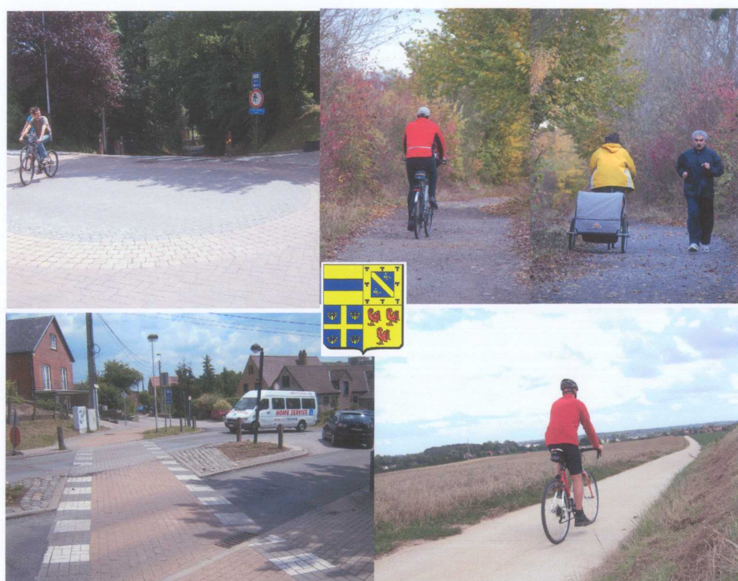
© Ville d'Ottignies - Louvain-la-Neuve - Service de Cartographie