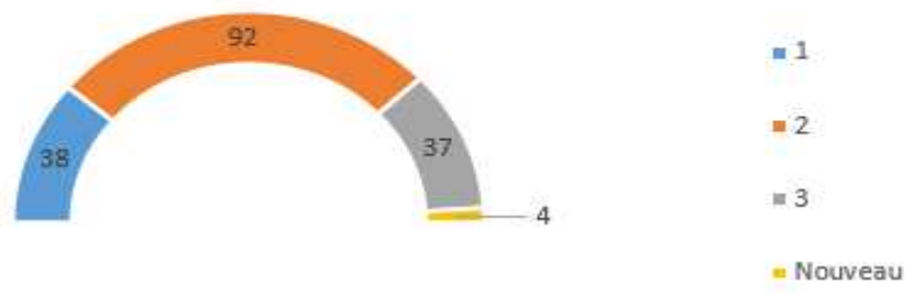
Nombre d'actions vs priorité

En termes de priorité du projet, 38 actions sont classées en 1, 92 en 2 et 37 en 3. On dénombre également 4 nouvelles actions, faisant passer le nombre d'actions du PST de 167 à 171. Après avoir réalisé ce travail, cette répartition nous semble équilibrée.